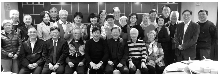
2021.2.6 召開本會第十一屆第五次理監事聯席會議