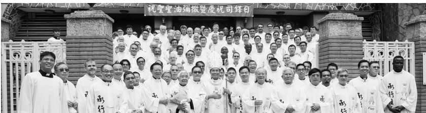
2021.4.1 總主教座堂舉行「祝聖聖油彌撒及慶祝司鐸日」

8. 4月1日（四）10:00民生西路總主教座堂舉行「祝聖聖油彌撒及慶祝司鐸日」包括教廷駐華代辦佳安道蒙席共150位神父參加，由鍾總主教安祝主禮。